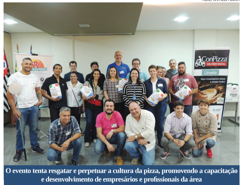
O evento tenta resgatar e perpetuar a cultura da pizza, promovendo a capacitação e desenvolvimento de empresários e profissionais da área