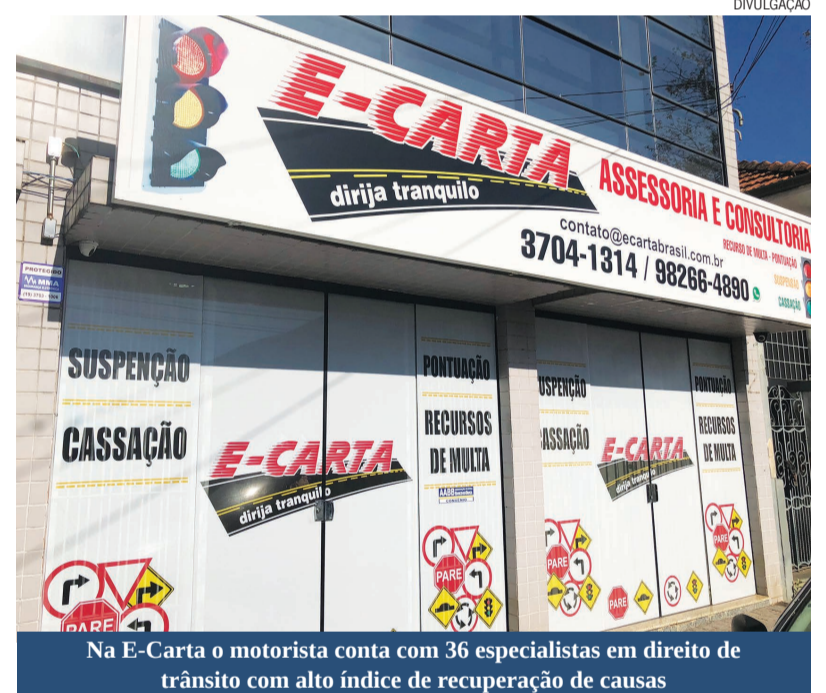
Na E-Carta o motorista conta com 36 especialistas em direito de trânsito com alto índice de recuperação de causas

A E-Carta Assessoria e Consultoria está a disposição para todos que necessitam e um respaldo jurídico ou orientação em relação a processos de trânsito. Está localizada em Limeira na Rua Deputado Octavio Lopes, 535, no Centro. Para mais informações basta